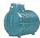
Erdspeicher 3.000 Liter